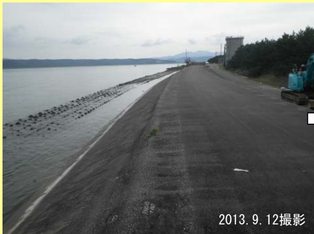
▲工事着手前(岩木川河口側から中泊方向)