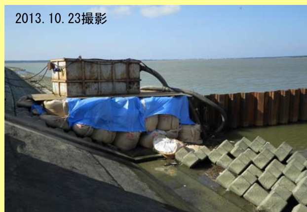
▲ 現在、仮締切内の排水作業を行っています 濁水が出ないように沈砂槽を通してあります