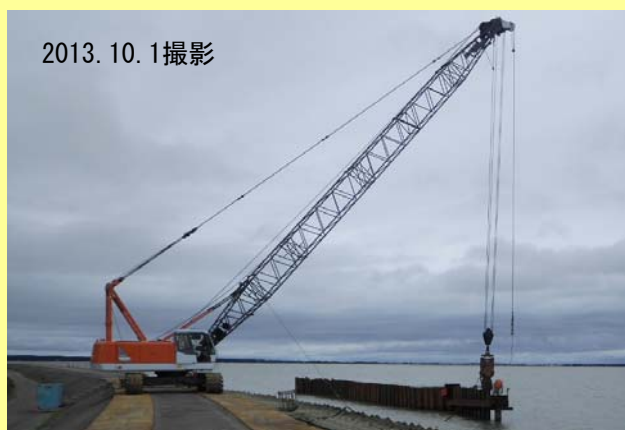
▲ 仮設鋼矢板設置作業の様子