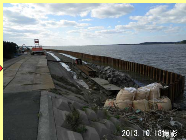
▲ 仮締切鋼矢板設置後