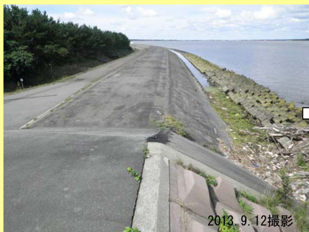
▲工事着手前(工事終点側から岩木川河口方向)