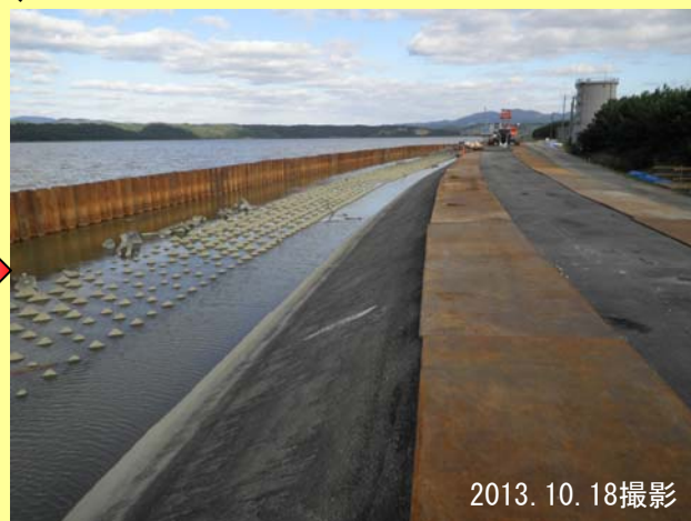
▲ 仮締切鋼矢板設置後